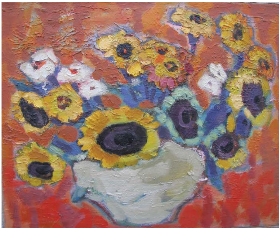
Eudochia Zavtur. Floarea-soarelui . 2009, 540×440 mm, u/p